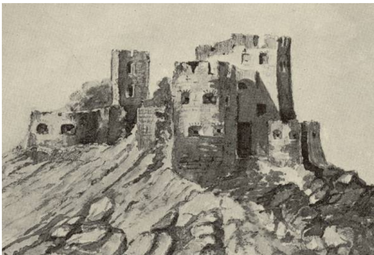
Hrad Turňa. Podľa starého avarelu.