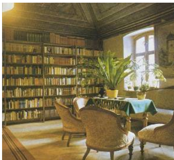
Pamätná izba Zoltána Fábryho.