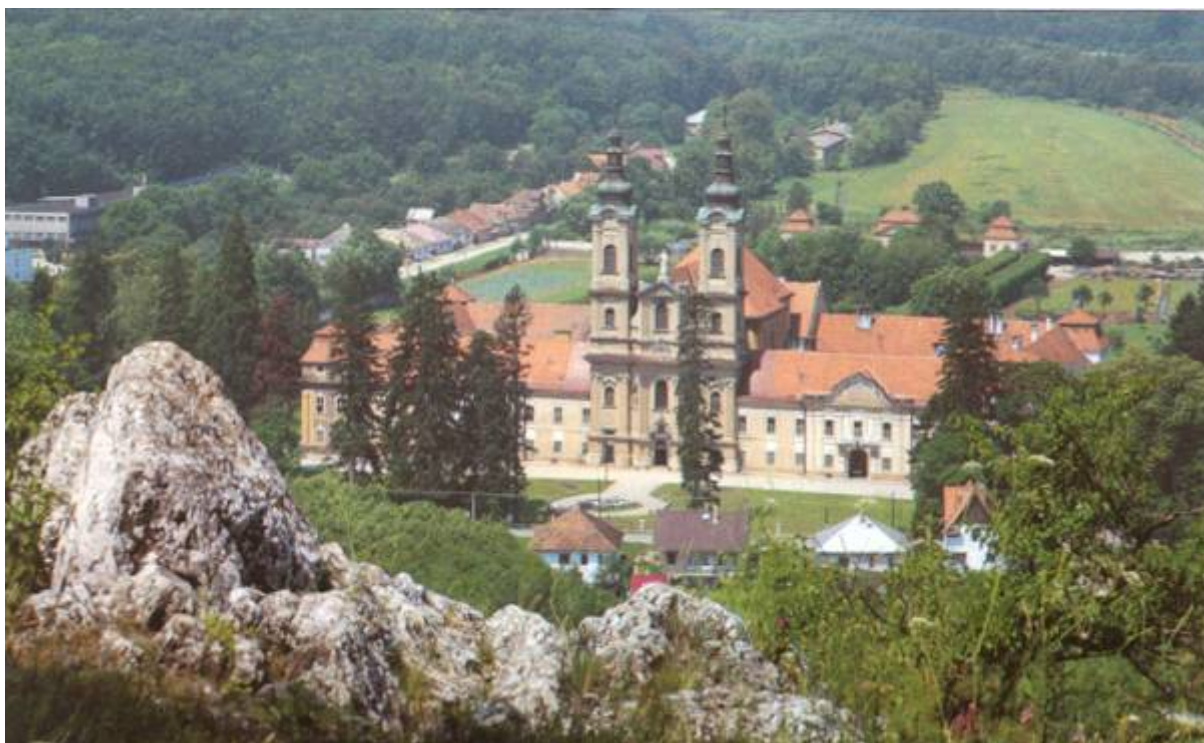
Jasov - Pohľad na kláštor z Jasovskej skaly.