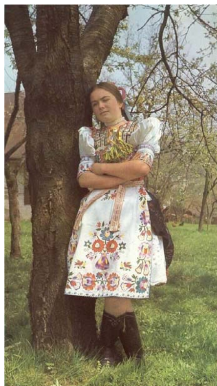
Kroj z Nižného Klatova