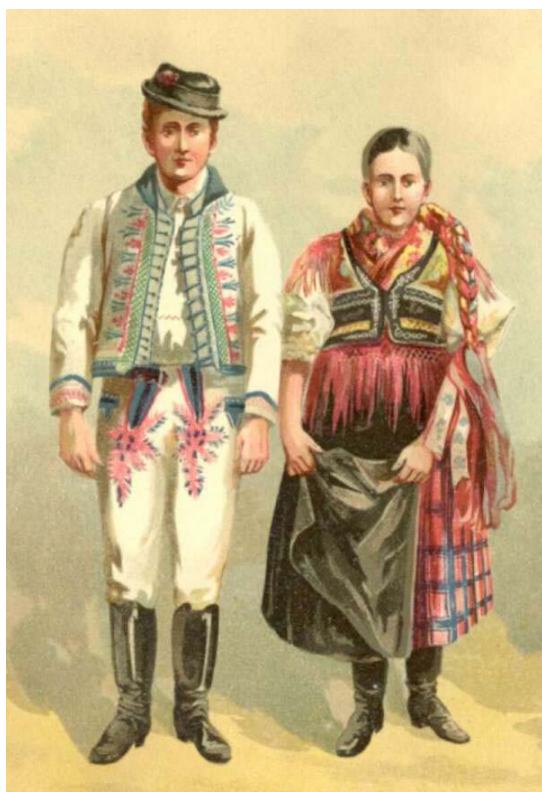
Kroj z Hrašovíka

odev ľudový - vývoj - stav súčasný - výskumy - Geča - Košická Nová Ves - Myslava - Slančik - Slanské Nové Mesto - Svinica - Valaliky - Vyšná Kamenica - Vyšný Klatov - Šaca - správy