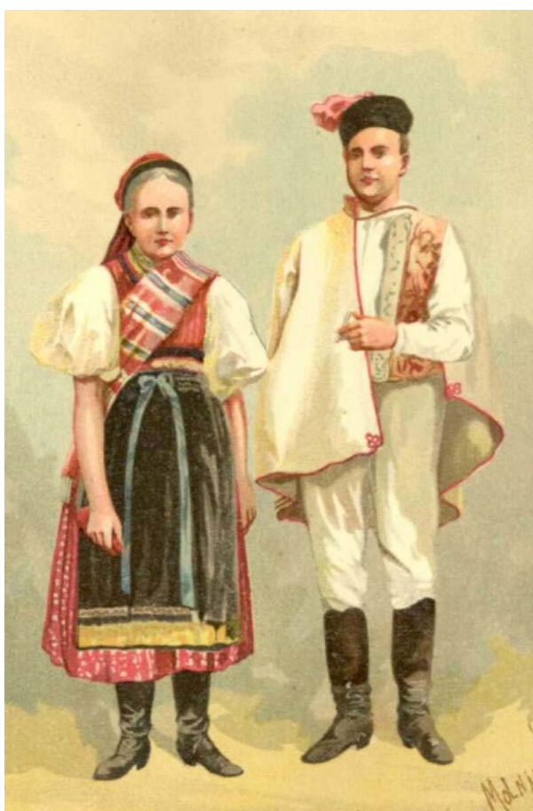
Kroj z Košických Hámrov