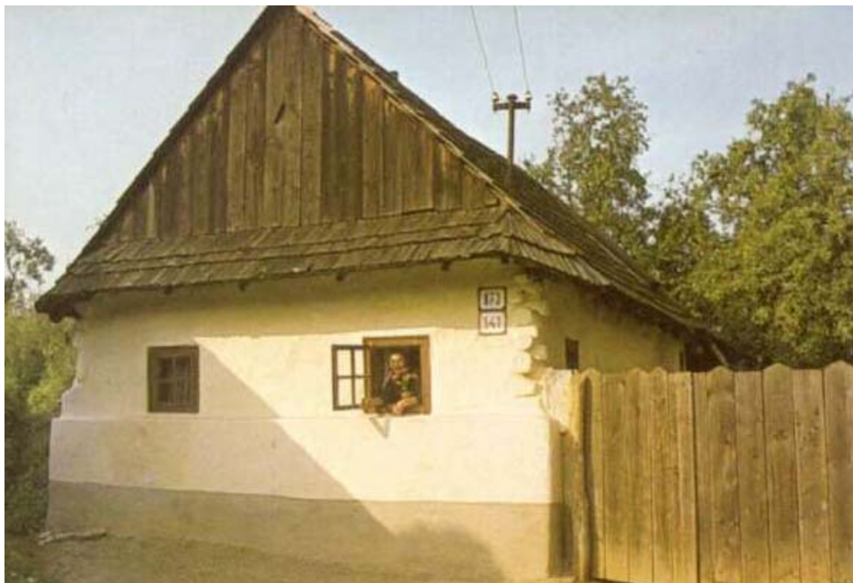
Dom z Medzeva