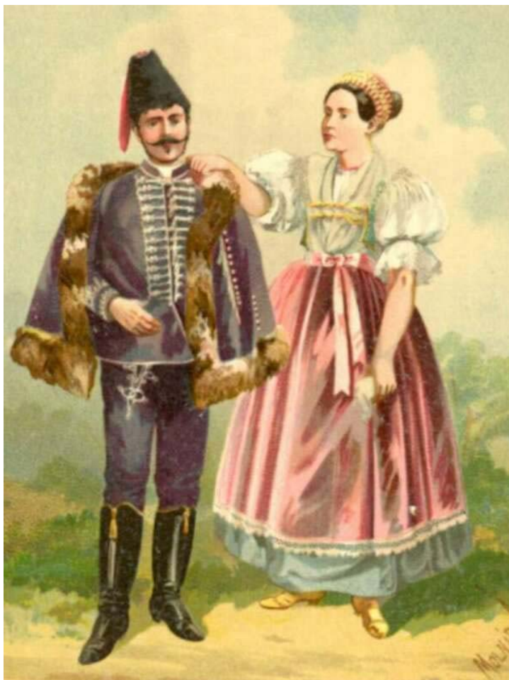
Kroj z Nižného Medzeva