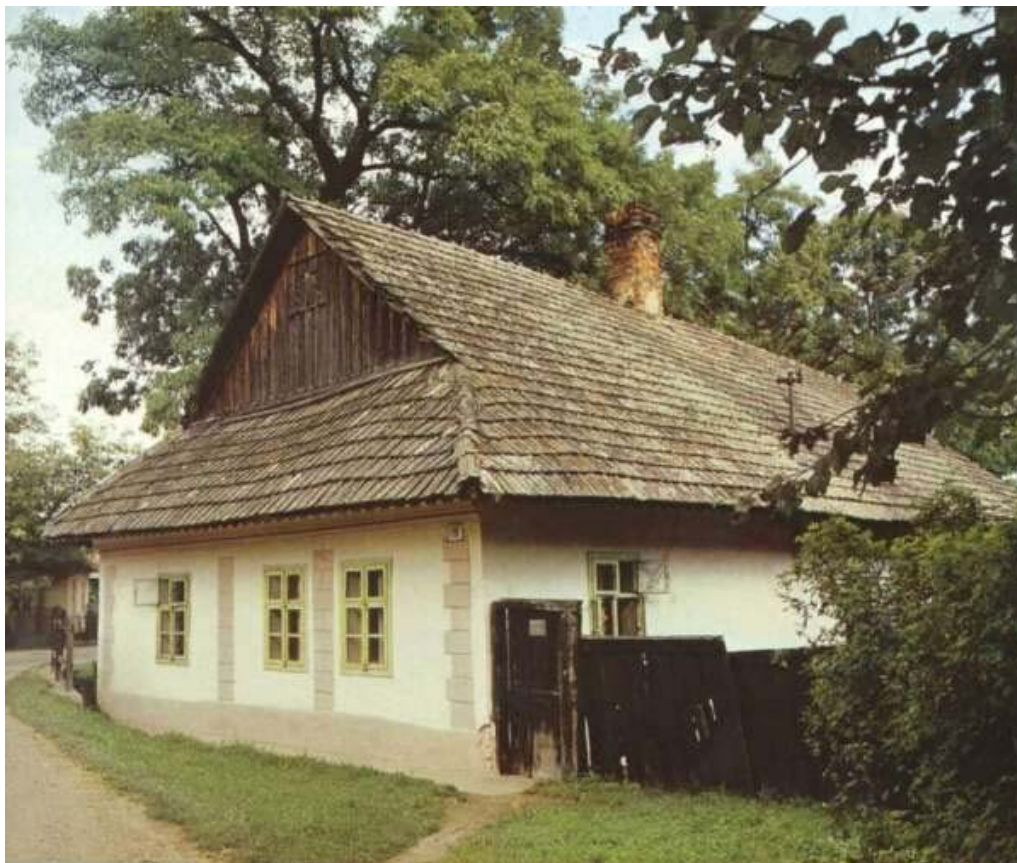
Dom z Novej Bodvy