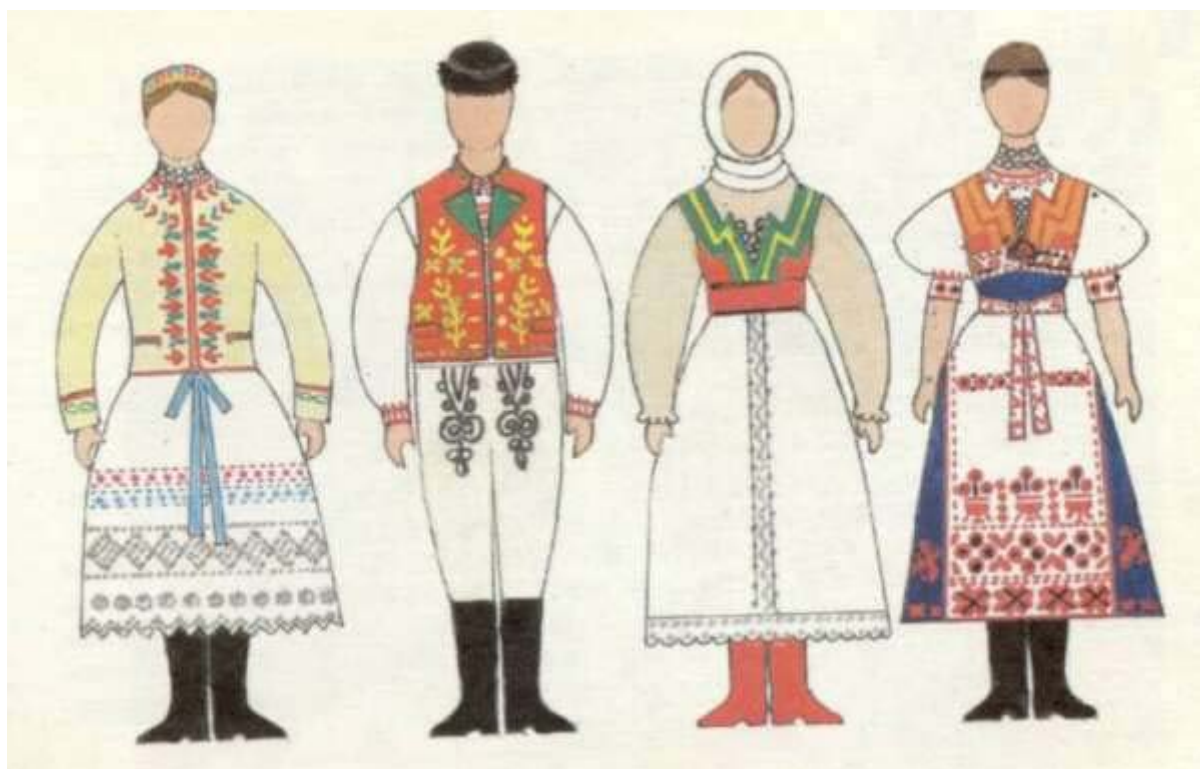
Kroj z Myslavý