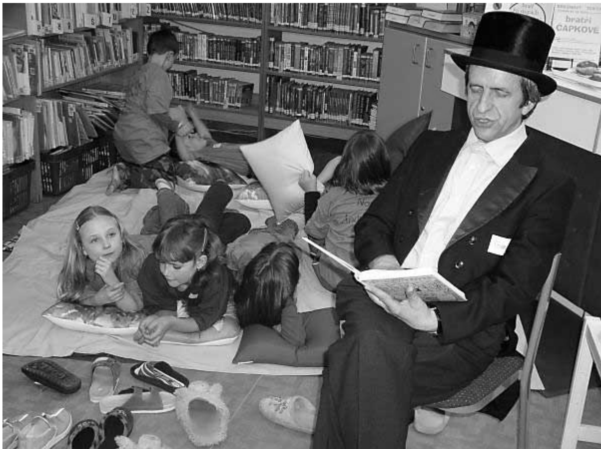
Návšteva Hansa Christiana Andersena v Knižnici vo Vysočine (ČR)

Medzi obľúbené návštevy patrí aj zavítanie samotného Andersena. Teda nie toho skutočného (asi by ste márne čakali :), ale dospeláka, ktorý je oblečený v dobovom kostýme, ktorý dokáže deťom prerozprávať svoj životný osud a zopár svojich rozprávok. Duch tohto velikána môže knižnicu navštíviť aj prostredníctvom svojich rozprávok, či už hlasným čítaním detí alebo dramatizáciou jeho diel profesionálmi, či samotnými účastníkmi podujatia. Samozrejme sa malí spáči neurazia, ak k nim zavíta Malá morská víla, Dievčatko so zápalkami..., či miestne osobnosti (starosta, primátor, herci, speváci... atď.)