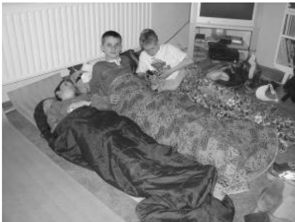
Nocľazníci - Valaliky

No nielen rozprávkami je človek živý. Jedlo a pitie si zabezpečí každý organizátor podujatia sám. Môžete sa popripade dohodnúť so sponzorom, ktorý Vám napríklad venuje sladké pečivo na akciu alebo Vám náklady spojené s jedlom a pitím uhradí mesto, alebo obec. Ďalšou alternatívou je individuálne stravovanie pre „spachtošov“ (s rodičmi sa dohodnete, že každý si so sebou prinesie jedlo i pitie). Nezabúdajte na skutočnosť, že podľa platných noriem, by do kontaktu s potravinami a pri podávaní jedla, mali prísť iba osoby s platným zdravotným preukazom.