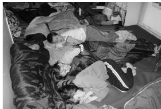
Spachtoši v Obcej knižnici v Seni ▲

V knižnici pripravíme miesta, na ktorých sa bude malým čitateľom dobre spať. Dôležité je, aby bol priestor pred akciou dôkladne uprataný (povysávaný, umyté dlážky...) Nezabúdajme ani na bezpečnosť, aby deti nespali na mieste ohrozujúcom ich zdravie (nestabilné regály, uvoľnené police...). Myslím, že deťom nebude chýbať prístup k sprche. Na najnutnejšiu hygienu nám postačí umývadlo a tečúca voda, kde si môžu umyť ruky a zuby.